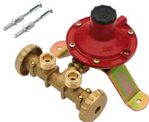
Reg. BP 4 kg/h con viti mod. LPZ 4-V (test a 30 mbar)